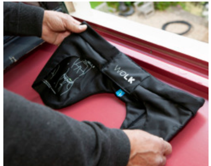
Maanden ervaring: Ervaring doelgroep met WOLK-Airbag

Neem dan contact met ons op via info@wolkairbag.com